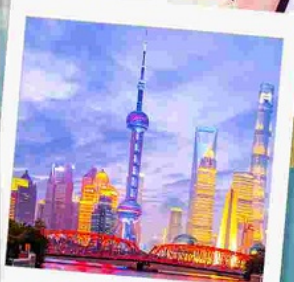
ทาดว่ายทาน