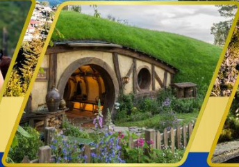
บ้านฮอบบิต อาหารแบบ BBQ