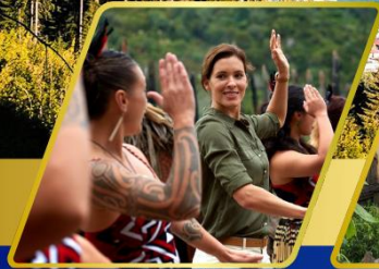
หมู่บ้านเมารี อาหารสไตลชีชาเมารี แบบแองจิ