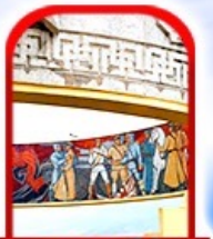
อนุสาวรีย์ โซซาน