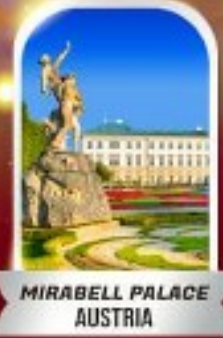
MIRABELL PALACE AUSTRIA