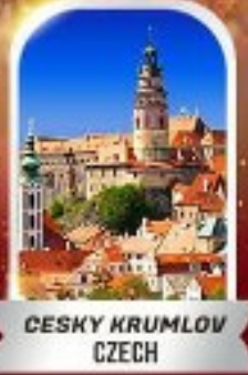
CESKY KRUMLOV CZECH