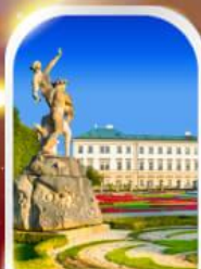
MIRABELL PALACE AUSTRIA