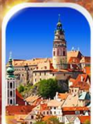
CESKY KRUMLOV CZECH