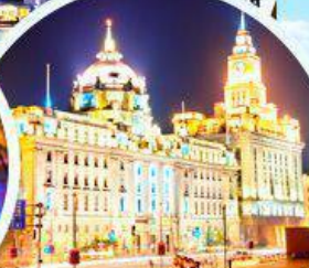
เดอะบันด์