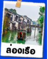
ล่องเรือ