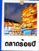
ตลาดร้อยปี