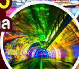
อุโมงค์เลเซอร์