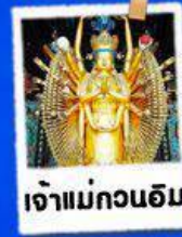
เจ้าแม่กวนอิม