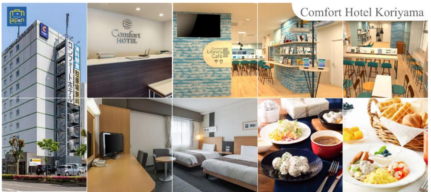
Comfort Hotel Koriyama

รับประทานอาหารเย็น ณ ภัตตาคาร (1) COMFORT HOTEL KORIYAMA หรือระดับเดียวกัน