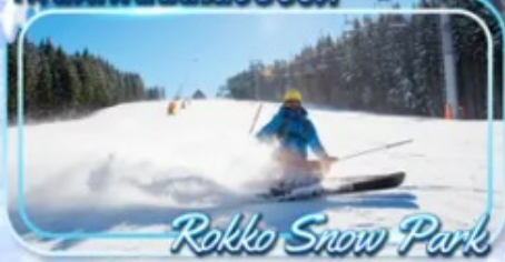
Rokko Snow Park