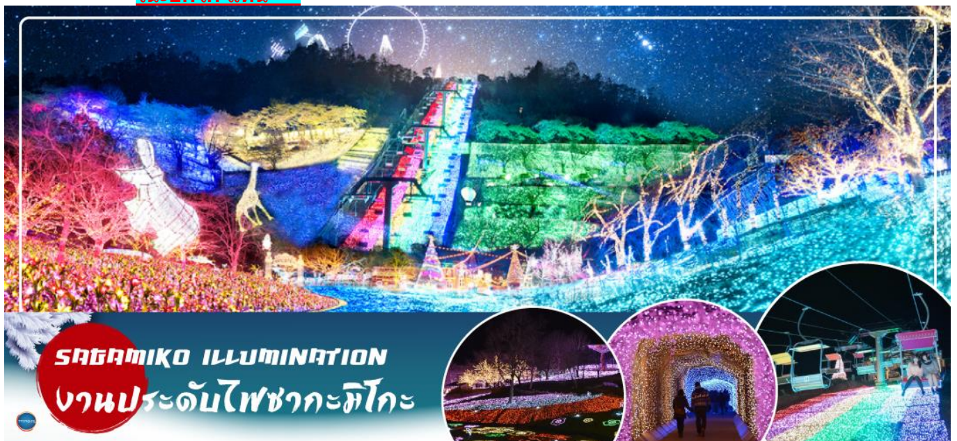
SAGAMIKO ILLUMINATION งานประดับไฟซากะมิโกะ

** ปกติงานประดับไฟซากะมิโกะ จะปิดทำการทุกวันพุธและพฤหัสบดี อ้างอิงจากงานประดับไฟของปี 2023 - 2024 กรณีที่กรุ๊ปเดินทางเข้าชมตรงวันหยุดของงานประดับไฟซากะมิโกะ ขอปรับเปลี่ยนโปรแกรมเป็น งานประดับไฟที่หมู่บ้านเยอรมัน (Tokyo german village) หลนแทนในวันถัดไป และที่เที่ยววันนี้จะเป็น หมู่บ้านโอชิโนะฮักไก แทน **