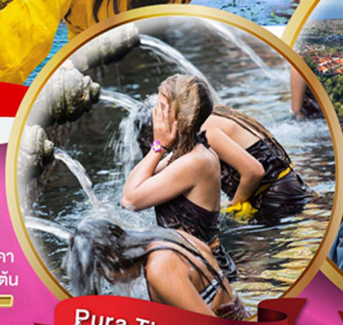
Pura Tirta Empul