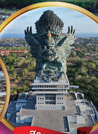
สวนวิษณุ