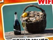
หอยนางรมสด กับไวน์ขาว