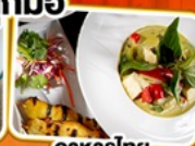
อาหารไทย ในยุโรป