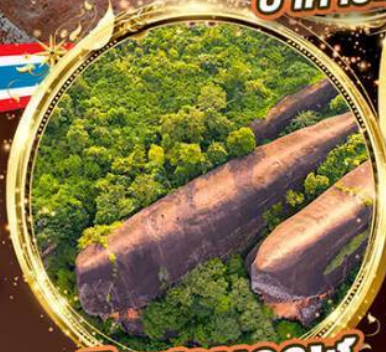
หินสามวาฬ