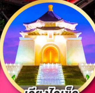
เจียงไคเช็ค