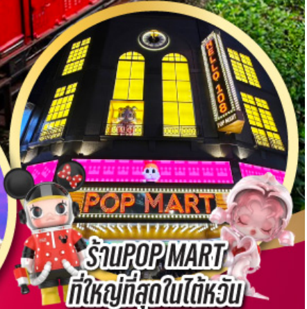
ร้าน POP MART ที่ใหญ่ที่สุดในไต้หวัน