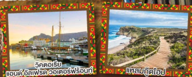
วิกตอเรีย แอนด์อัลเฟรดวอเตอร์ฟรอนท์

เปิดประสบการณ์กับภัตตาคาร Carnivore สวรรค์ของคนรักเนื้อสัตว์