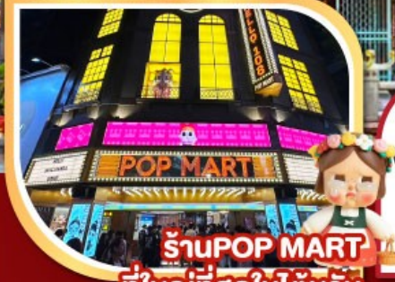
ร้านPOP MART ที่ใหญ่ที่สุดในไต้หวัน