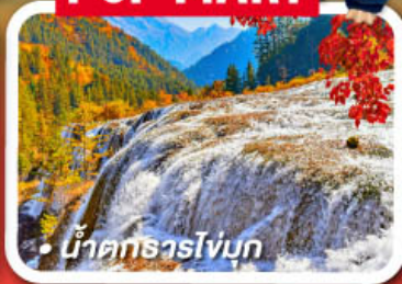
น้ำตกธารโง่บูก