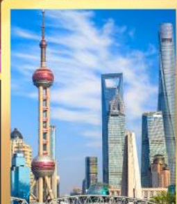
เซี่ยงไฮ้