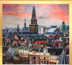
อัมสเตอร์ดัม