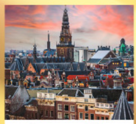
อัมสเตอร์ดัม

เดินทาง 29 พ.ย-7 ธ.ค. 67 56,500 06-14 ธ.ค. 67 56,500 20-28 ธ.ค. 67 62,500