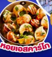
หอยเอสคาร์โก