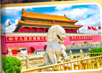
จตุรัสเทียนอันเหมิน