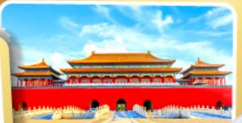
พระราชวังต้องห้าม