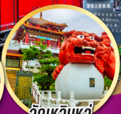
วัดเหวินหวู่