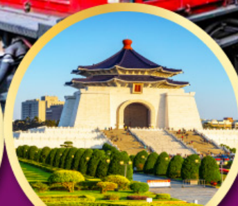
อนุสรณ์สถานเจียงไคเช็ค