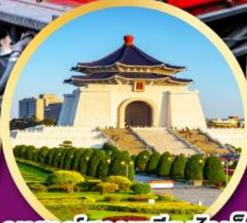
อนุสรณ์สถานเจียงไคเช็ค