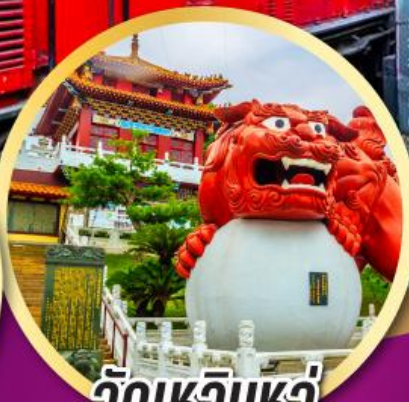
วัดเหวินหวู่