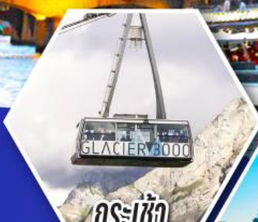
กระเช้า กลาเซียร์ 3000