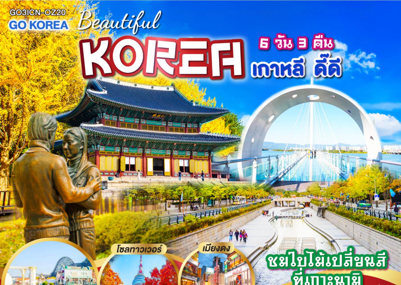
โซลทาวเวอร์