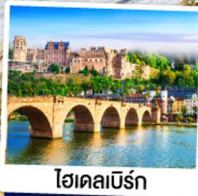
ไฮเดลเบิร์ก