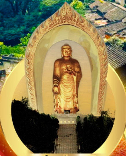
พระใหญ่ตงหลิง