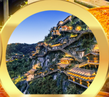
หุบเขาเทวดา