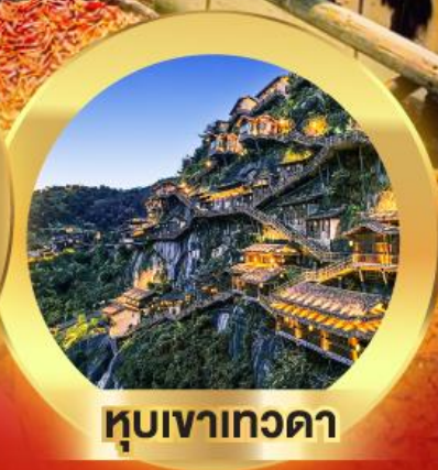
หุบเขาเทวดา