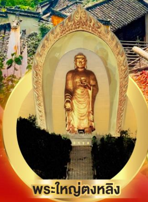
พระใหญ่ตงหลิง