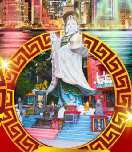
เจ้าแม่กวนอิม ทาครีฟส์ลีย์