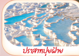
ปราสาทปูยฝ้าย