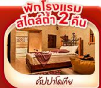
พักโรงแรม สัปดาห์ 2 คืน