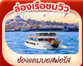
ล่องเรือชมวิว

พิเศษ! ล่องเรือชมความสวยงามช่องแคบ 2 ทวีป “ช่องแคบบอสฟอรัส”