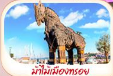
ม้าไม้เมืองทรอย