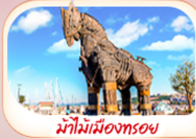
ม้าไม้เมืองทรอย