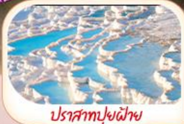
ปราสาทปุยฝ้าย