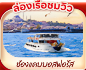
ล่องเรือชมวิว