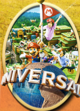
อิสระเลือกซื้อบัตร Universal Studios Japan