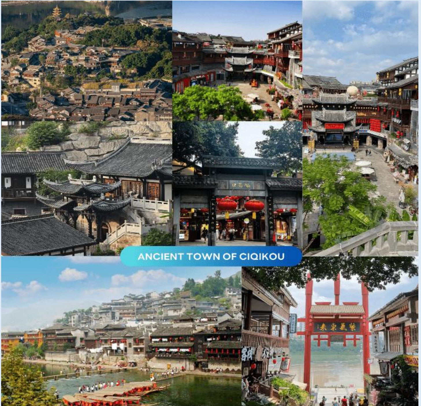
ANCIENT TOWN OF CIQIKOU

นำท่านสู่ หมู่บ้านโบราณฉือชิว่ (Ancient Town of Ciqikou) เป็นหมู่บ้านอนุรักษ์ทางวัฒนธรรมที่มีชนเผ่ากลุ่มน้อยหลากหลายเชื้อชาติอาศัยอยู่ อาคารบ้านเรือนภายในหมู่บ้านคงรูปแบบของสถาปัตยกรรมจีนดั้งเดิมไว้ ซึ่งให้เราได้สัมผัสกลิ่นอายย้อนยุคสมัยราชวงศ์ซ่ง หมิง และชิง พร้อมกับเลือกซื้อของที่ระลึก หรือของฝาก