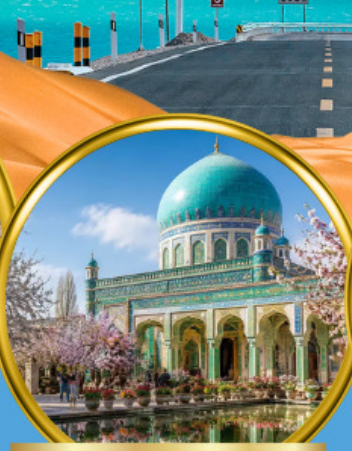
สุสานสมหอมเซียนเฟย