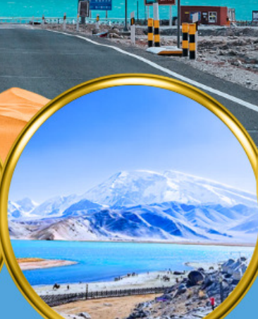
Kala Kule Lake