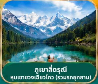
กูเขาสีดรุณี หุบเขาของเจียวโกว (รวมรถอุทยาน)