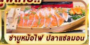
ซาบูหมือไฟ ปลาแซลมอน