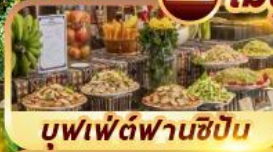
บุฟเฟ่ต์ฟานซีปัน