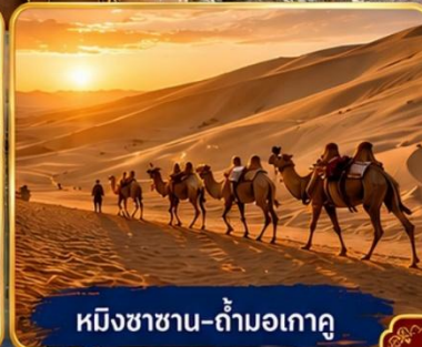
หมิงซาซาน-ถ้ำมอเกาคู