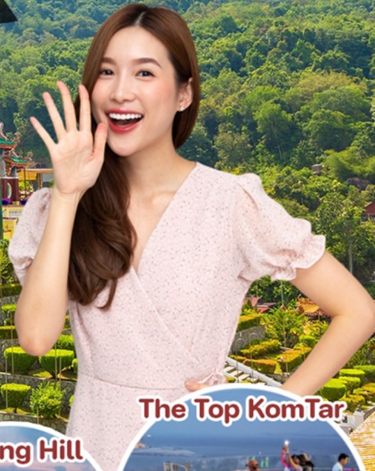
The Top KomTar