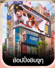
ซ้อปป์ชินจูกุ

✈️ คอนเฟิร์ม ออกเดินทาง ทุกพีเรียด 2 ท่านขึ้นไป