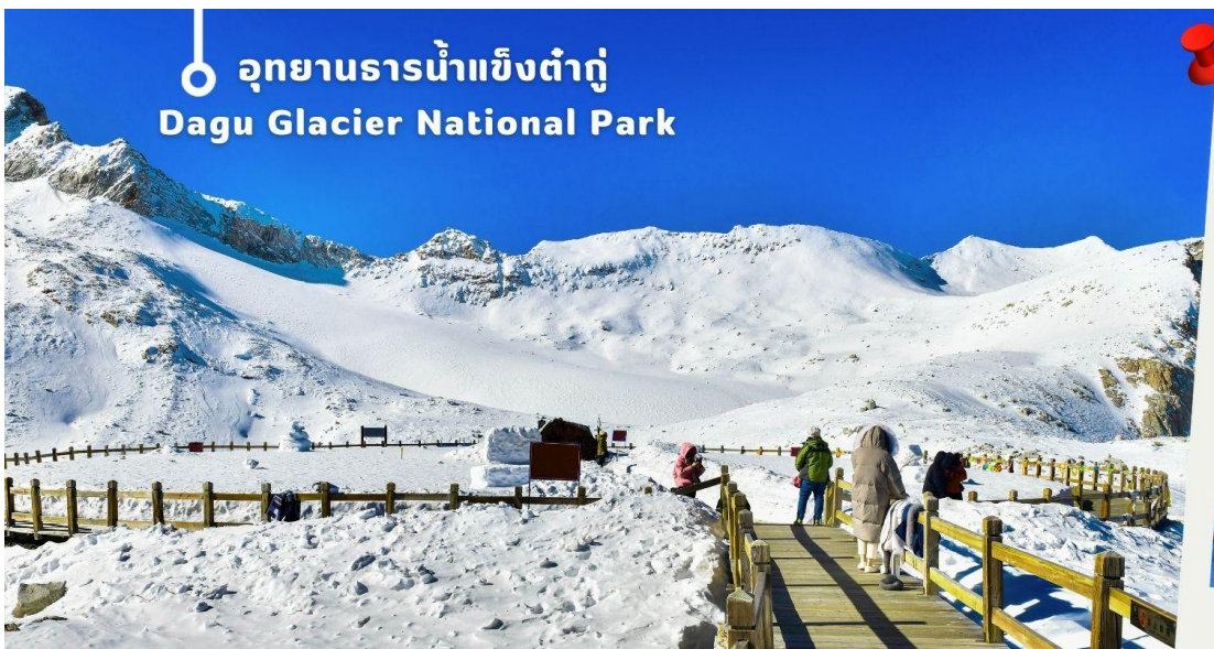
อุทยานธารน้ำแข็งต้ากู่ Dagu Glacier National Park

จากนั้นนำท่านเดินทางสู่ เมืองเฮยซู่ (ใช้เวลาเดินทางประมาณ 2 ชั่วโมง)เพื่อเดินทางไปยัง อุทยานธารน้ำแข็งต้ากู่ (รวมกระเช้าขึ้นลง) ต้ากู่ปังชว่น หรือ Dagu Glacier National Park เป็นธารน้ำแข็งกลาเซียร์ที่สวยงามที่สุดแห่ง