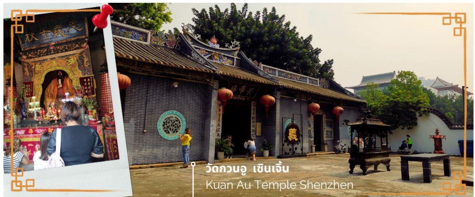
วัดกวนอู เซินเจิ้น Kuan Au Temple Shenzhen

จากนั้นนำท่านเดินทางสู่ วัดกวนอู ไหว้เทพเจ้ากวนอู สัญลักษณ์ของความซื่อสัตย์ ความกตัญญูรู้คุณ ความจงรักภักดี ความกล้าหาญ โชคลาภ และบารมี ท่านเปรียบเสมือนตัวแทนของความเข้มแข็งเด็ดเดี่ยวของอาจไม่ครั้งคร้ามต่อศัตรู ท่านเป็นคนจิตใจมุ่งมั่นคงตั้งขุนเขา มีสติปัญญาเฉลียวฉลาด และไม่เคยประมาทการบูชาขอพรท่านก็หมายถึงขอให้ท่านช่วยอุดช่องว่างไม่ให้เพลิงพล้ำแก่ฝ่ายตรงข้าม และให้เกิดความสมบูรณ์ด้วยคนข้างเคียงที่ซื่อสัตย์ หรือบริวารที่ไว้วางใจได้นั้นเองดังนั้นประชาชนคนจีนจึงนิยมบูชา และกราบไหว้เพื่อความเป็นสิริมงคลต่อตนเอง และครอบครัวในทุกๆ ด้าน