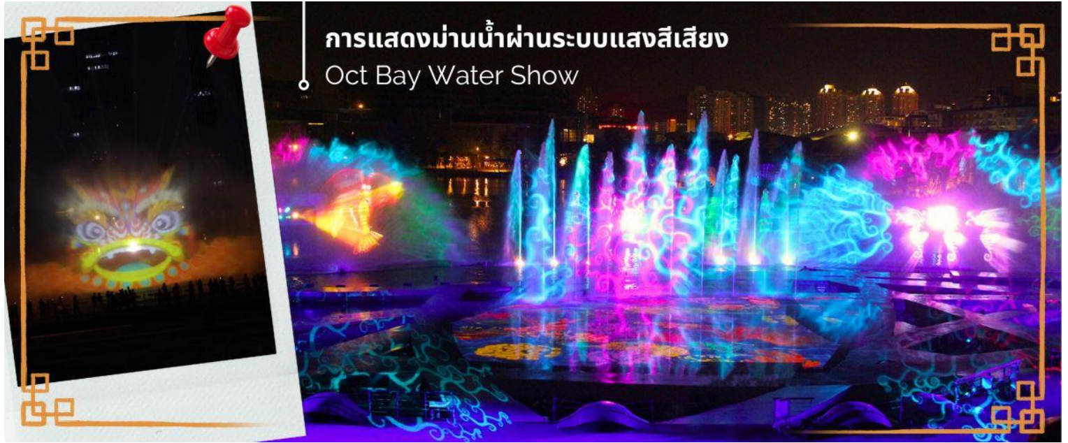
การแสดงม่านน้ำผ่านระบบแสงสีเสียง Oct Bay Water Show

โรงแรมที่พัก นำท่านเดินทางเข้าสู่ที่พัก Shenzhen Trends Luohu or Similar 3* Hotel ★★ ★ หรือเทียบเท่า