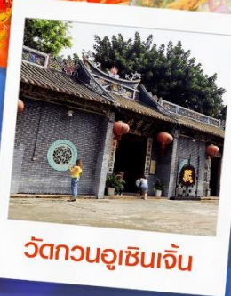
วัดกวนอูเซินเจิ้น