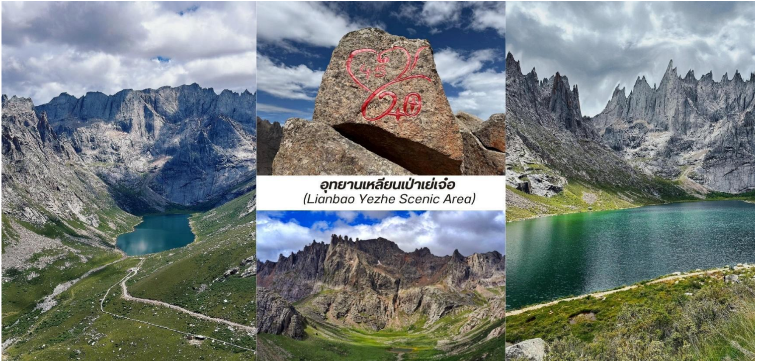
อุทยานเหลียนเป่าเย่เจ้อ (Lianbao Yezhe Scenic Area)

นำท่านเข้าชม อุทยานเหลียนเป่าเย่เจ้อ (Lianbao Yezhe Scenic Area) รวมค่าบริการรดน้ำเที่ยวภายในอุทยาน) ตั้งอยู่ในเขตที่ราบสูงอาปา มณฑลเสฉวน ประเทศจีนที่นี้คือขุมทรัพย์ทางธรรมชาติที่ยังคงความบริสุทธิ์ไว้อย่างสมบูรณ์เป็นสถานที่ท่องเที่ยวที่ได้ชื่อว่าเป็น “สวรรค์แห่งภูเขาและ ทะเลสาบ” ด้วยทิวทัศน์ อันยิ่งใหญ่และงดงาม หัวใจของเหลียนเป่าเย่เจ้อคือความอลังการของ ยอดเขาหิบนแกรนิต ที่มีรูปทรงแปลกตาและแหลมคมนับไม่ถ้วนมีความสลัซบซ้อน คล้ายกับป้อมปราการธรรมชาติ ยอดเขาสีเทาดำเหล่านี้ตั้งตระหง่าน อยู่ท่ามกลางผืนดินที่เขียวชอุ่มและรายล้อมด้วย ทะเลสาบสีมรกตและสีคราม ที่ใสราวกับกระจก ทะเลสาบแต่ละแห่งสะท้อนภาพของยอดเขาได้อย่างสมบูรณ์แบบราวกับเป็นภาพวาดในจินตนาการอย่างงดงาม