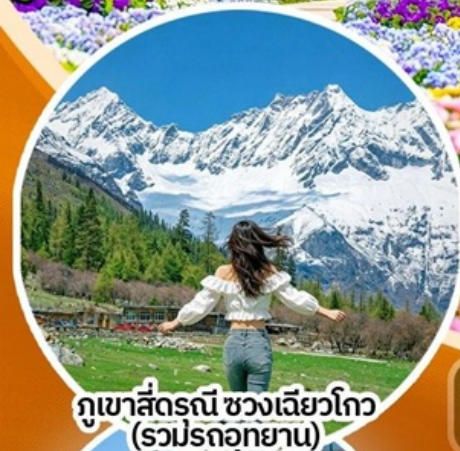
ภูเขาสี่ดรุณี ช่วงเลียวโกว (รวมรถอุทยาน)