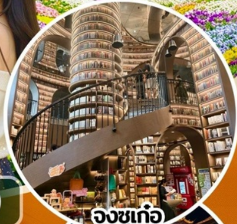
จงซูเก๋อ

สวนสวรรค์แห่งดอกไม้ MANHUA - จงซูเก๋อ - จัตุรัสหย่างเกียมวู่ - รูปปั้นแพนด้าเซลฟ์ เมืองโบราณกวนเซียน - อุทยานเขาสี่ดรุณี (รวมรถอุทยาน) - สะพานหนานเจียว เมืองลั่วไถ่ - ตึกแฝด - SKP - วัดต้าจื่อ - ถนนคนเดินซุนซีลู่ - IFS - ดงเจียวจี้จี้ - ถนนคนเดินไท่กุหลี่