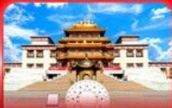
วัดพระโพธิสัตว์จุลาน