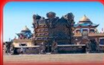
ศูนย์วัฒนธรรม มองโกเลีย หยวนหลิว