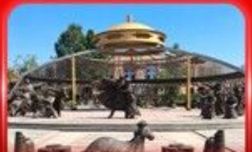
สวนวัฒนธรรมการแต่งจานอวอร์ดอส