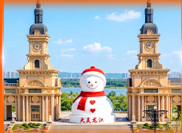
ตึกตาสหิมะยักซ์ ฮาร์บิน