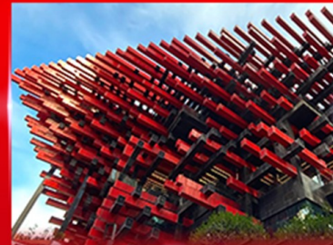
แลนด์มาร์คดิง ตึกตะเกียบ