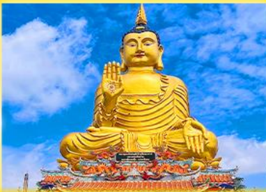
หลวงพ่อหลวงพ่อดำ