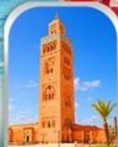
JEMAA EL-FNAA MARRAKESH