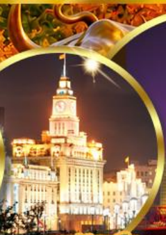
เดอะมันด์