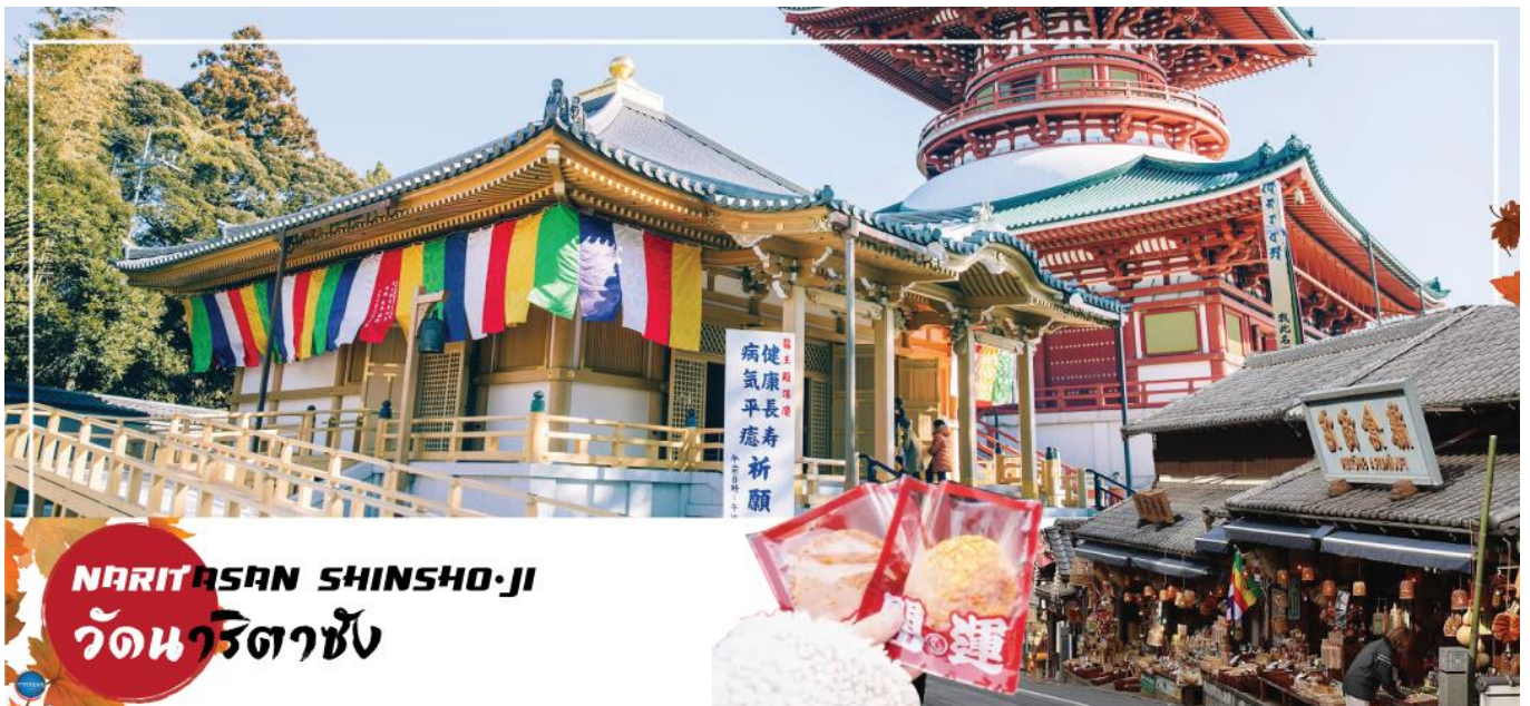
NARITASAN SHINSHO-JI วัดนาริตาชิน

เมืองนาริตะ – วัดนาริตะชิน – ถนนปลาไหล โอโมเตะซังโตะ – กรุงโตเกียว – ตลาดปลาซึกิจิ – ชมมวยยักษ์3มิติ พร้อมช้อปปิ้งย่านชินจูกุ – เมืองนาริตะ