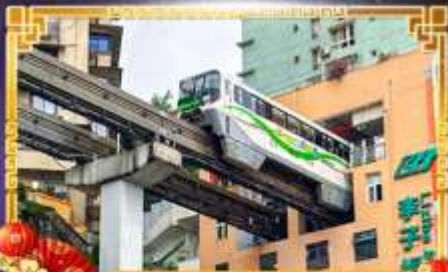
รถไฟฟ้า-ลู่ตีก