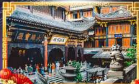
วัดหลิวหนาน