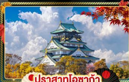
🍁 ปราสาทโอซาก้า