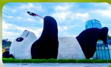
หมีแพนด้าเซลฟ์