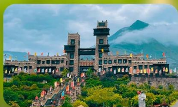
หมู่บ้านโบราณชนเผ่าเซียง