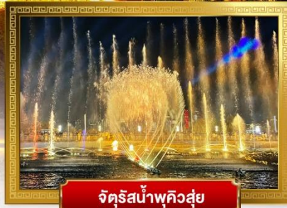
จัดรีสน้ำพุควิสู่ย