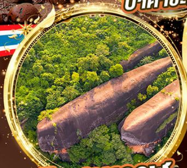
หินสามวาฬ