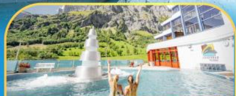
แช่น้ำแร่ร้อนฟ่อนคลายลวยคอร์บิค