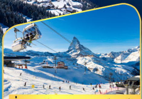
นั่งกระเช้าชมแมทเทอร์ฮอร์น