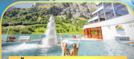
แช่น้ำแร่ร้อนผ่อนคลายลวยคอร์บิต