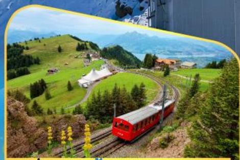
นั่งรถไฟขึ้นสู่ยอดเขาโรทิก