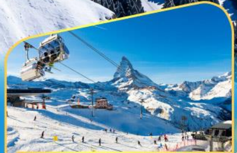
นั่งกระเช้าชมแมทเทอร์ฮอร์น